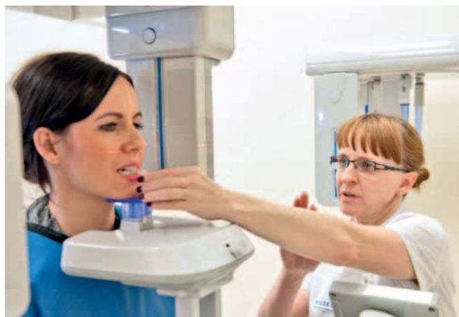
Wszelkie zabiegi poprzedzane są wykonaniem zdjęcia, które w większości przypadków jest niezbędne do rozpoczęcia oraz prawidłowego leczenia