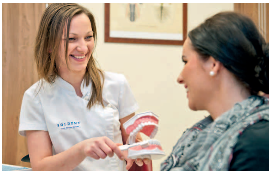
Podczas każdej wizyty u higienistki pacjenci są szkoleni z zasad prawidłowego szczotkowania i używania nitki. Prezentowane są najnowocześniejsze rozwiązania ułatwiające higienę jamy ustnej

Pacjent dość często czuje lęk i obawy związane z planowaną wizytą w gabinecie stomatologicznym. Dla nas podstawą jest dobrze wykonany zabieg oraz zadowolenie pacjenta. ▶